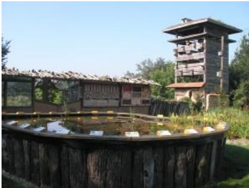
Lebensturm mit Hochteich